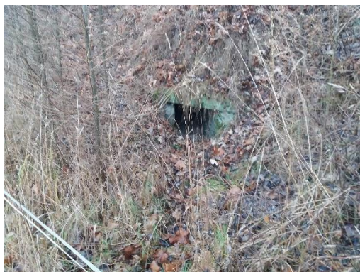
O 03 Pohled na výtok

Propustek je využíván pro převedení občasného vodního toku. Jedná se o jednokolejnou neelektrifikovanou celostátní trať.