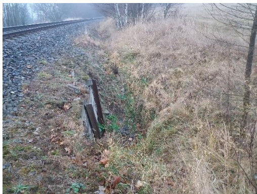
O 01 Pohled ve směru staničení